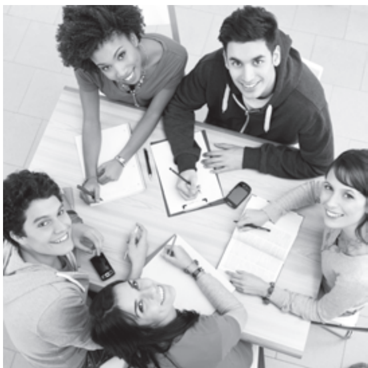
Programas de estágio e trainee são portas de empresa nas empresas