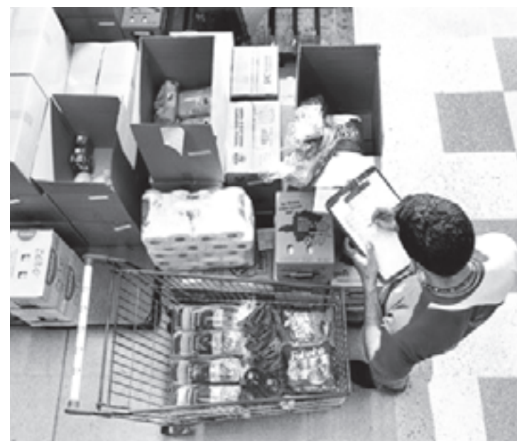
Uma das funções é realizar o controle das datas de validade da seção

• Interessados devem se inscrever pelo site < https://www.vagas.com.br/ >.