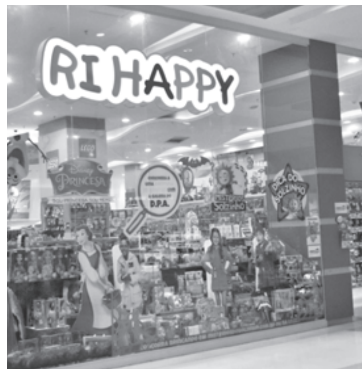
Vagas são para os cargos de caixa, vendedor, estoquista e empacotador

Os interessados deverão se cadastrar através do site < www.rihappy.com.br/vagastemporarias >.