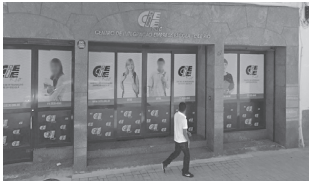
CIEE auxilia os jovens a iniciarem suas carreiras por meio dos programas de estágio

São 872 vagas para o ensino superior e 384 para o ensino médio, incluindo técnicos e jovem aprendiz