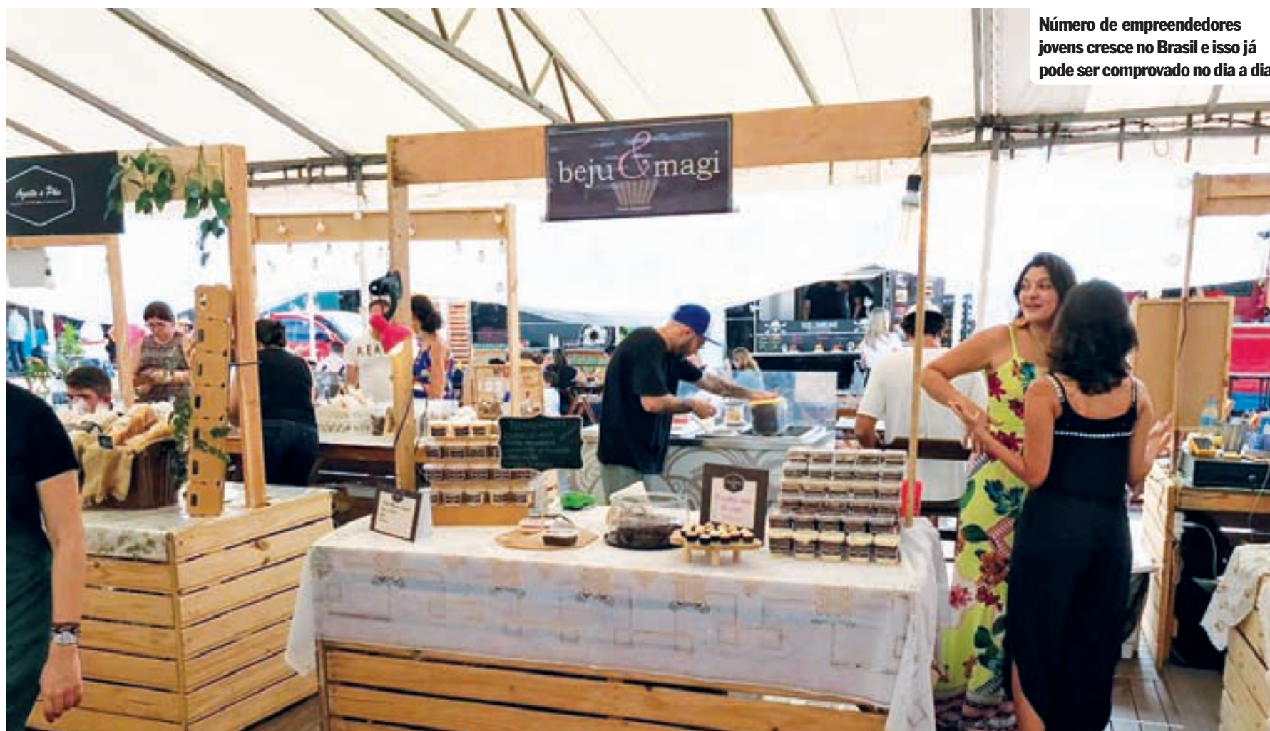
Número de empreendedores jovens cresce no Brasil e isso já pode ser comprovado no dia a dia