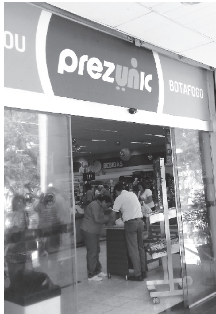
É necessário que os interessados tenham ensino médio

Os interessados devem se cadastrar por meio do site < www.vagas.com.br/cencosud-brasil >. As lojas físicas não recebem mais currículos de papel.